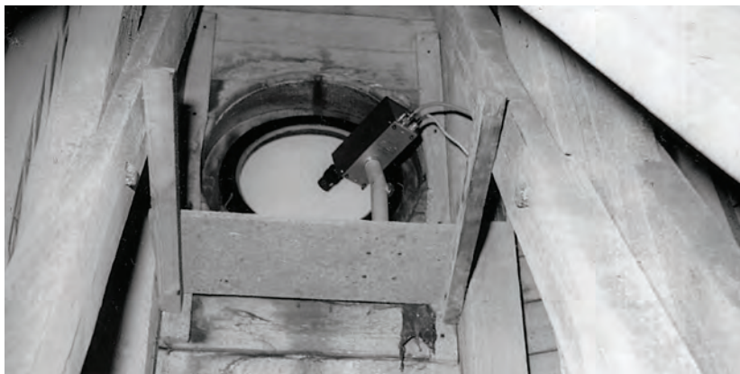
Instalace kamery v nárožní věži