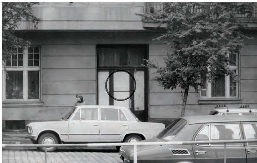
Vchod do opěrného bodu Správy sledování StB z ulice Čs. armády 368/5