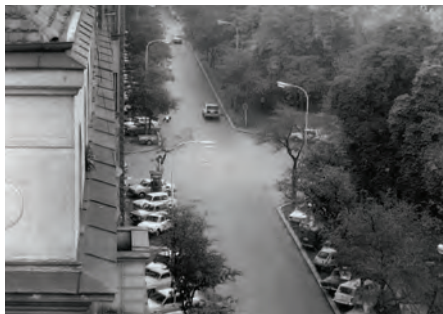
Záběr kamery na Bubenečskou ulici a vpravo plot rezidence amerického velvyslance