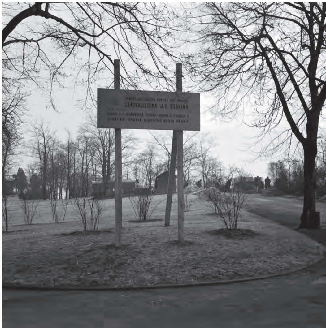
Obr. 1.2 Překotná výstavba: tabule oznamující veřejnosti přípravy k položení základních kamenů pomníku při příležitosti Stalinových 71. narozenin v prosinci roku 1949; v této době ještě nebylo rozhodnuto o výtvarném řešení, stavební podobě ani přesném umístění monumentu. V pozadí lze vidět jedno ze stavebních provizorií přímo v prostoru budoucího fundamentu, které náleželo Stavebnímu podniku hlavního města Prahy.

internovaných pak dokreslují drobné předměty denní potřeby (brýle, hřebeny), zvláštní kategorií jsou vlastní uměleckořemeslné výrobky coby specifický druh tzv. zákopového umění. V rámci sídlištního odpadu lze pozorovat významné rozdíly v životním standardu jednotlivých skupin zadržovaných, který se může lišit například v užívání stolního skla a porcelánu, kvalitě konzumovaného masa, v přístupu k alkoholickým nápojům či