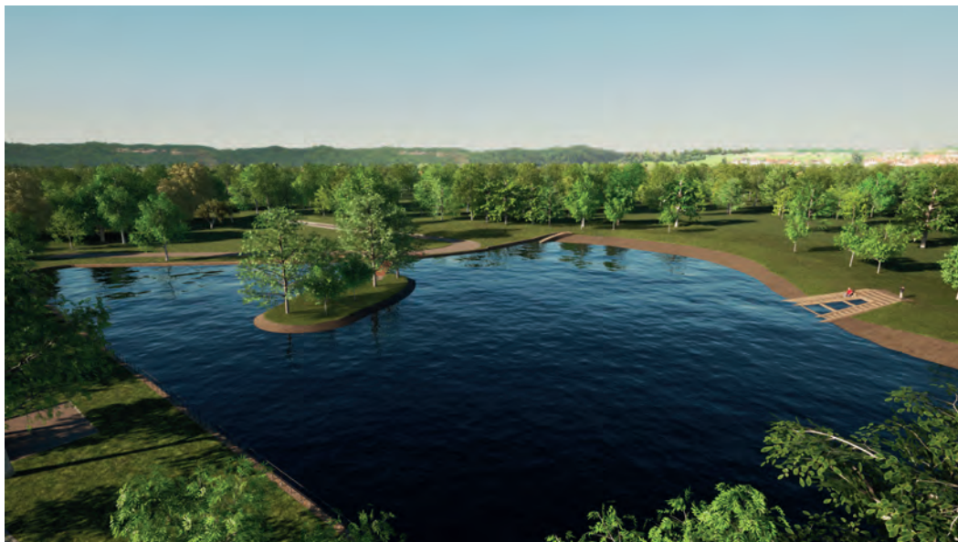
Obr. 1.3 Vizualizace vodní nádrže s ostrůvkem v jihozápadní části Letenských sadů, při jejíž výstavbě došlo na jaře roku 2021 k záchrannému archeologickému výzkumu pracovního tábora.