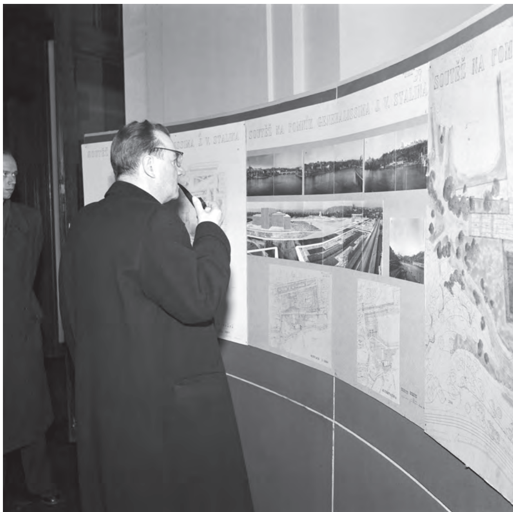
Obr. 1.1 Státní úkol: Klement Gottwald osobně 20. prosince 1949 studuje soutěžní architektonické návrhy na ztvárnění Stalinova pražského monumentu.

doklady inženýrských sítí (elektřina, vodovod, splašková kanalizace) a managementu srážkové vody, který je v případě koncentrace značného množství osob na malé ploše naprostou nezbytností.