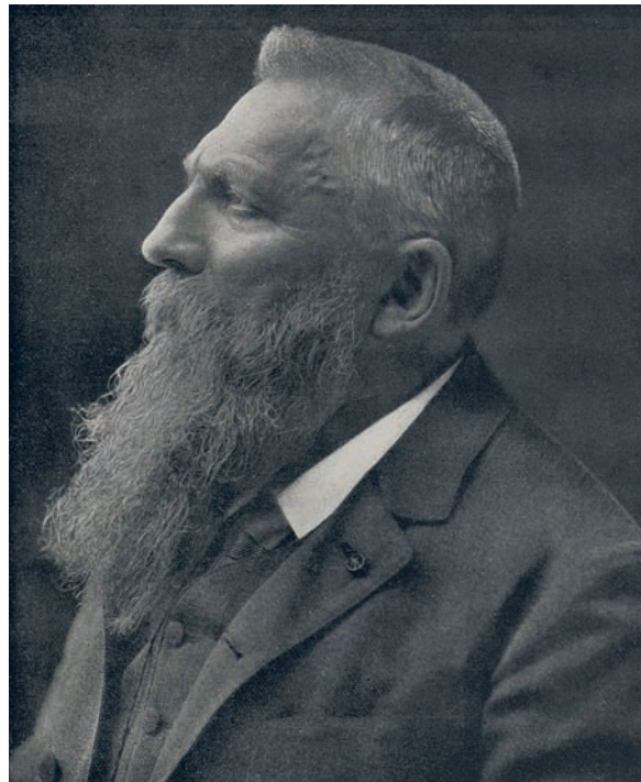
Obr. 96b Francouzský sochař Auguste Rodin na snímku fotoateliéru Eckert z roku 1902