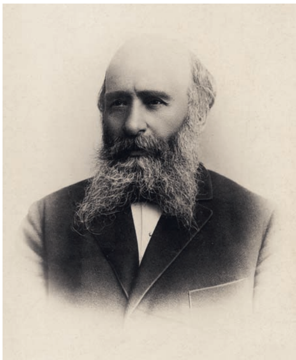
Obr. 95a Přespolní člen České akademie bulharský historik a slavista Marin Stojanov Drinov