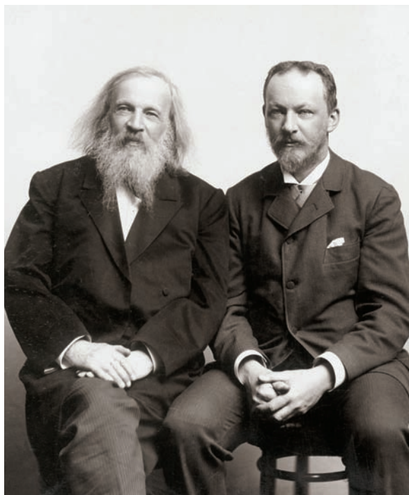
Obr. 95c Bohuslav Brauner s ruským chemikem Dmitrijem Ivanovičem Mendělejevem