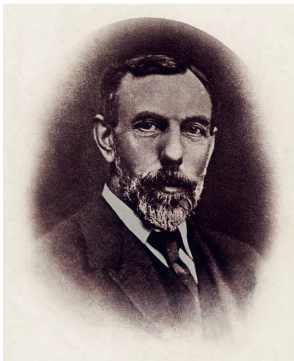
Obr. 95d Přespolní člen ČA a nositel Nobelovy ceny skotský chemik William Ramsay