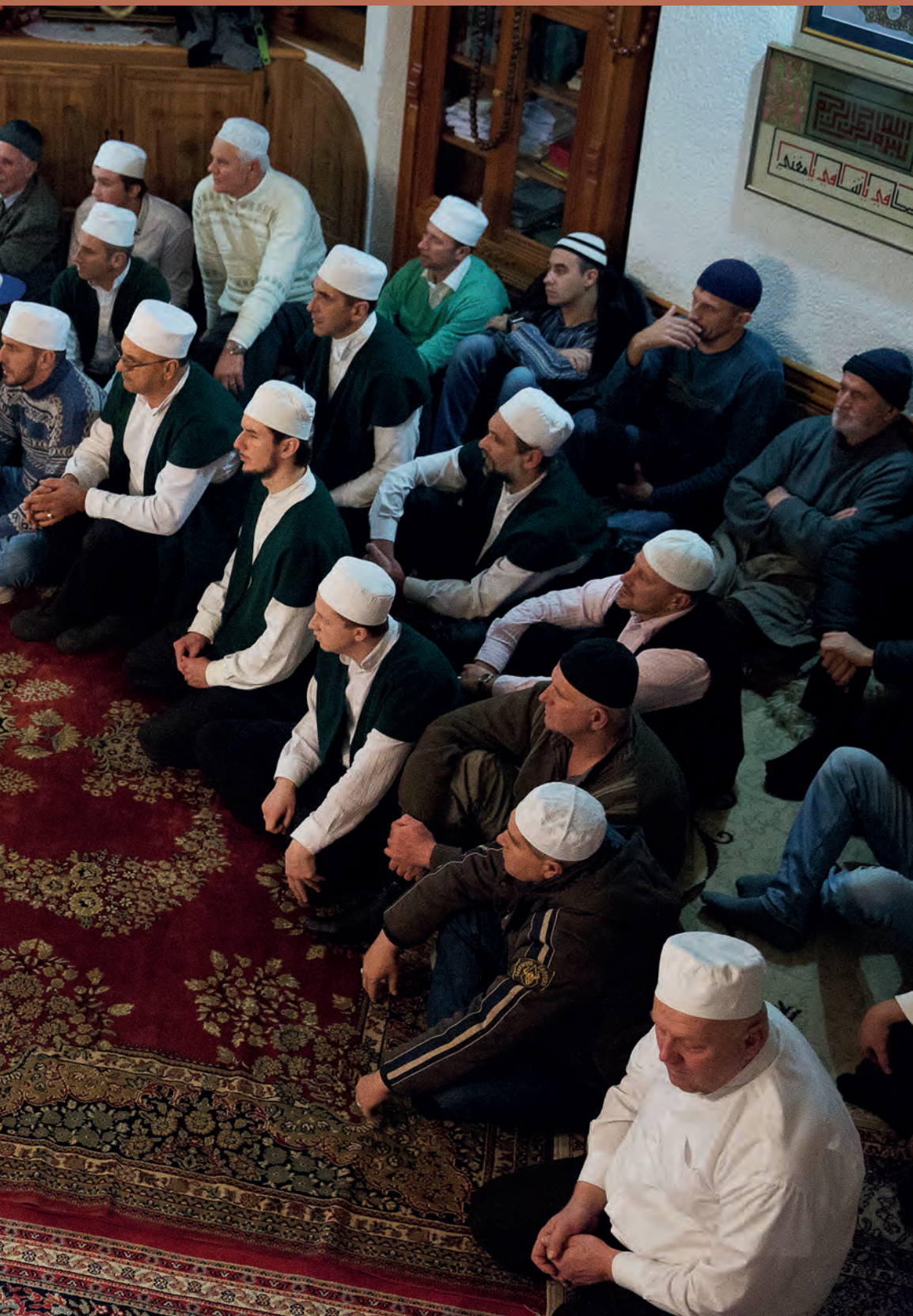
Súfijští muslimové tančívají k počtě Boha (Bosna, 2015).