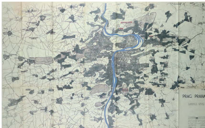
4. prosinec 1941: Albert Speer v Praze

Obr. 2a–b Praha. Sada plánů Plánovací komise předložená Albertu Speerovi. Odpovědný: Reinhold Niemeyer, srpen 1940. Nynější a budoucí územní zpracování kalů v oblasti Prahy (č. 4), Zastavěné plochy s plánovanými plochami rozšíření (č. 10).