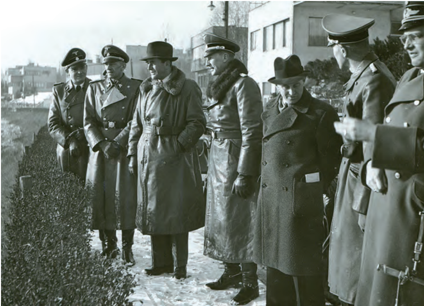
4. prosinec 1941: Albert Speer v Praze