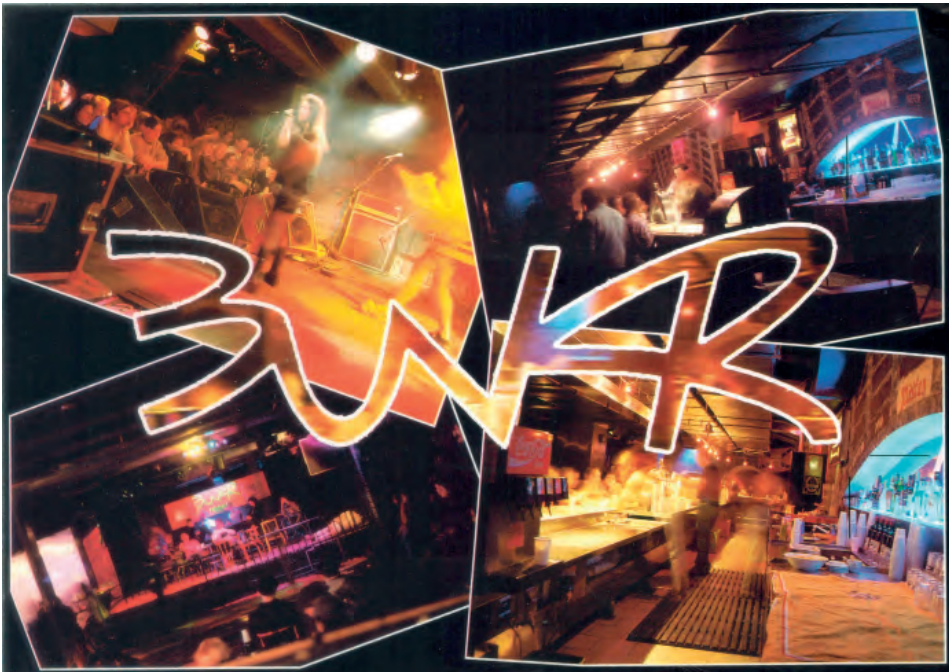
Propagační pohlednice klubu

rekrutují některé klasické bunkrovské ságy, jako je třeba ta o Lemmy z Motörhead, který si v Bunkru při jedné ze svých pražských návštěv zajamoval. V březnu 1993 se tu natáčel slavný český díl kultovního pořadu MTV 120 Minutes , za jehož záznam by leckterý pamětník prodal svou babičku, kdyby nějakou měl.