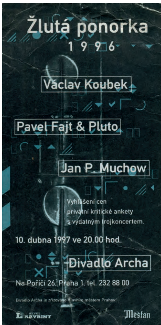
Reklamní letáčky na akce v Arše