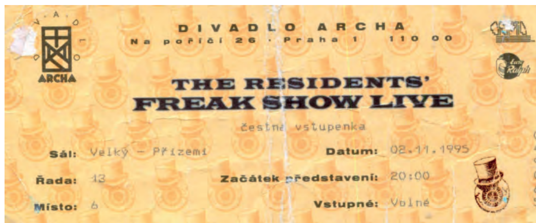
Vstupenka na legendární koncert The Residents

Už v první sezoně 1994–1995 tu proběhly nezapomenutelné koncerty Davida Byrnea, Diamandy Galás či skupiny Colosseum. Vladimír Mišík & Etc... tu na podzim 1994 nahráli album Live & Unplugged... (i když zlé jazyky posléze špičkovaly, že se záznam musel ve studiu notně vyspravit). Hned v té druhé následovalo památné představení Freak Show The Residents, v určitých kruzích české hudbymilovné veřejnosti požívajících až kultovní postavení.