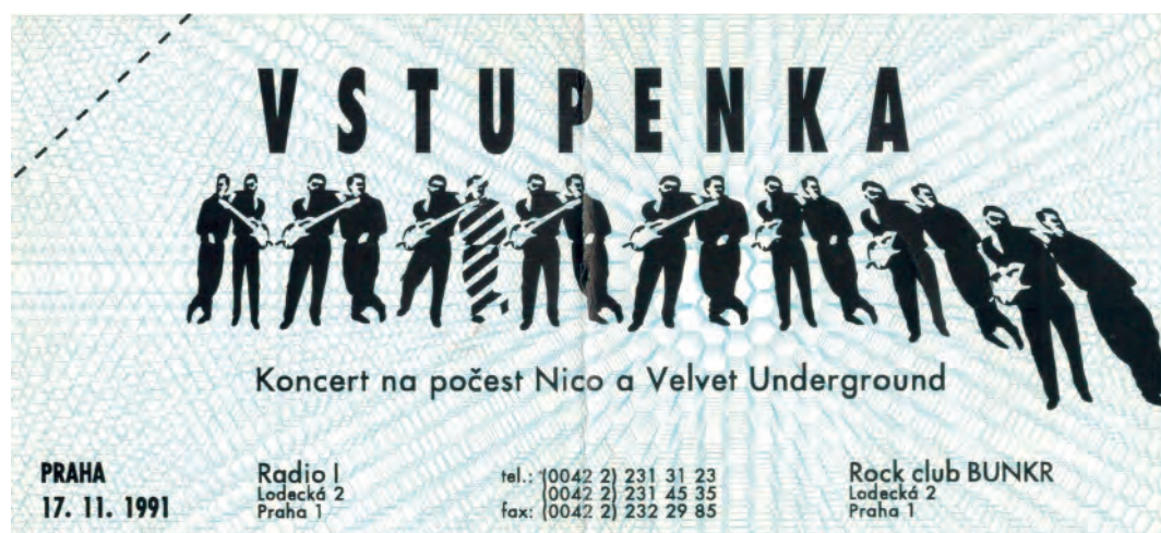
Vstupenka na slavnostní otevření klubu Bunkr v roce 1991

a po letech se i člověk, kterého konec klubu tehdy rozhořčil, umí vžít do pocitů lidí, kteří bydleli léta okolo.