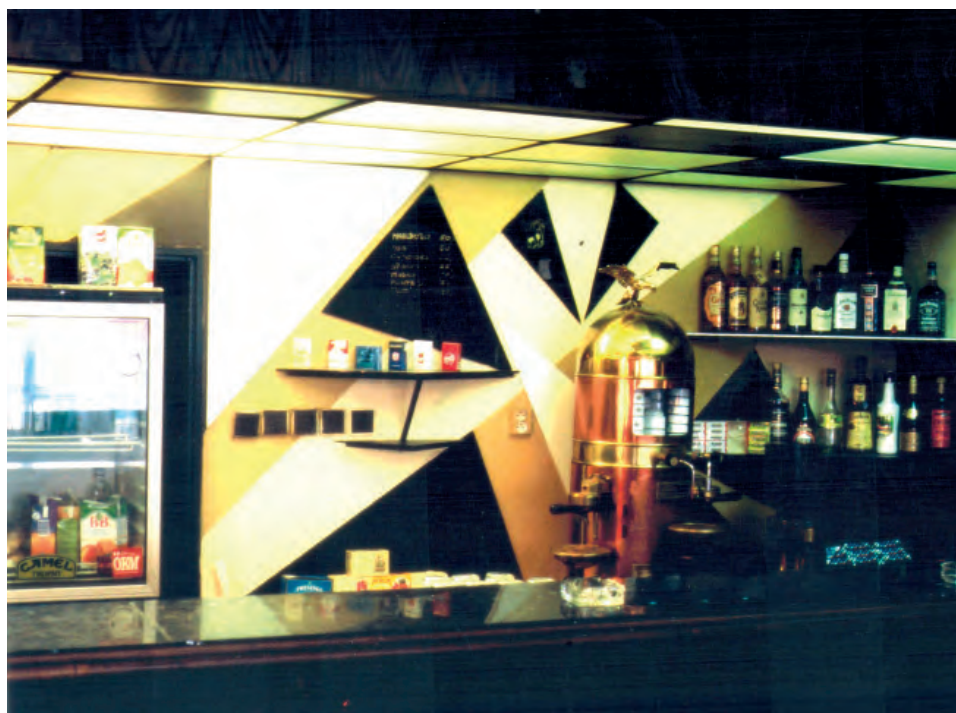
Vchod do klubu Bunkr a pohled do kavárny.