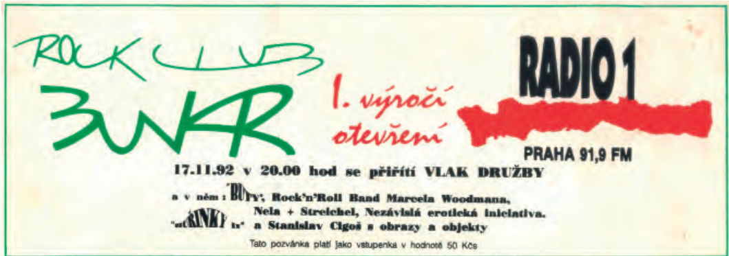
Vstupenka k 1. výročí otevření klubu

rekrutují některé klasické bunkrovské ságy, jako je třeba ta o Lemmy z Motörhead, který si v Bunkru při jedné ze svých pražských návštěv zajamoval. V březnu 1993 se tu natáčel slavný český díl kultovního pořadu MTV 120 Minutes , za jehož záznam by leckterý pamětník prodal svou babičku, kdyby nějakou měl.