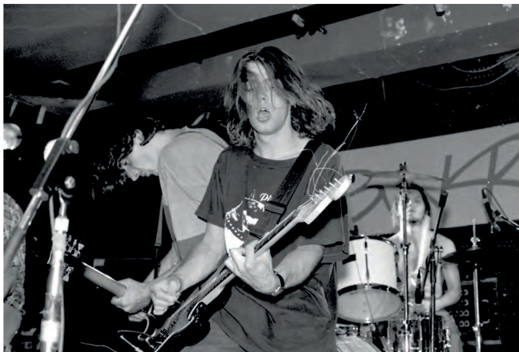
Skupina Houpací koně na pódiu v klubu Bunkr.

P. S.: Příběh Bunkru má jeden žertovný appendix. V dubnu 1993 totiž vznikl jeho mladší sourozenec. Nyní pozvěme na scénu Ondřeje Soukupa, komentátora Hospodářských novin a vynikajícího znalce ruských reálií, který ten příběh před lety zpřístupnil čtenářům časopisu Rock & Pop . „Moskevský Bunkr se