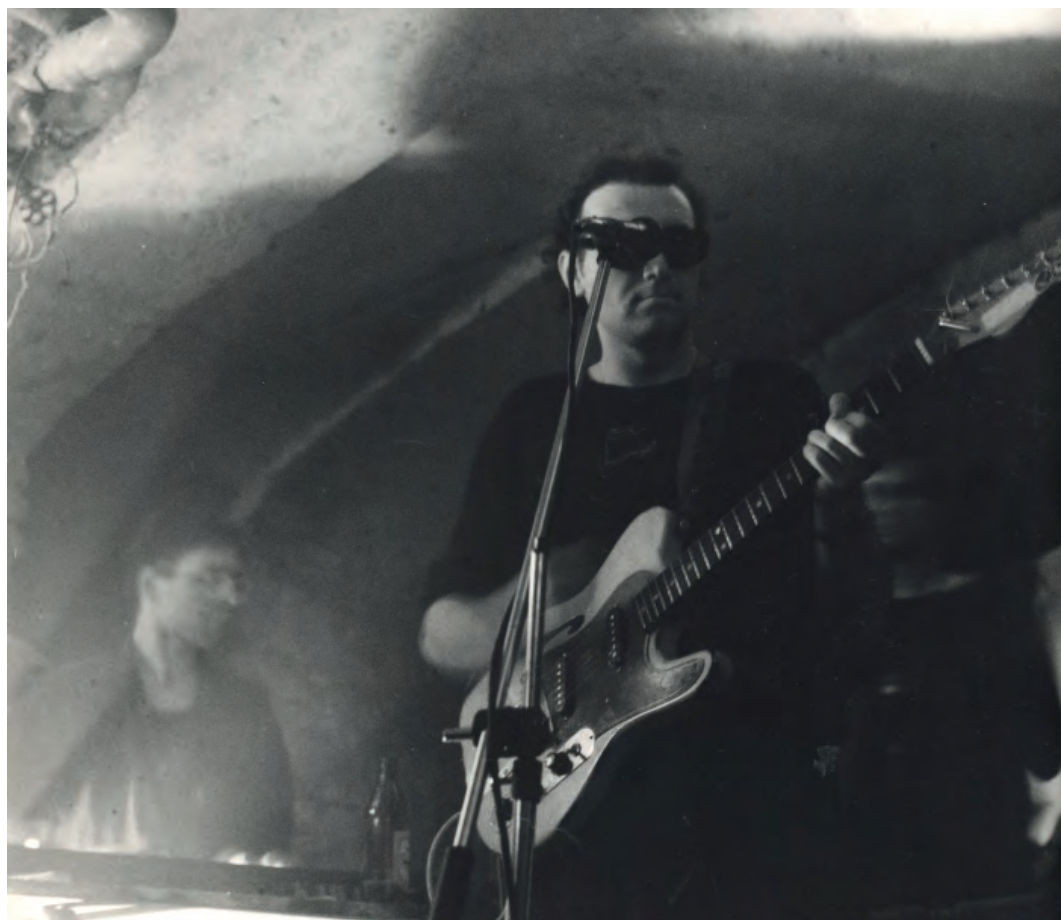
Pražská skupina Kokochod na jednom z koncertů v Kotelně.

K objevu bývalé uhelny v podzemí domu vedle paláce YMCA došlo už na podzim 1989. Prostor očištěný od hromad koxu sloužil nejdřív jako zkušebna skupiny Michael's Uncle, ale – jak se píše ve Voknovinách 20/1990, kde je celý ten příběh podán v epické šíři – „nápad i chuť tady byly, a tak se z uhelny začal postupně rýsovat rockový klub“.