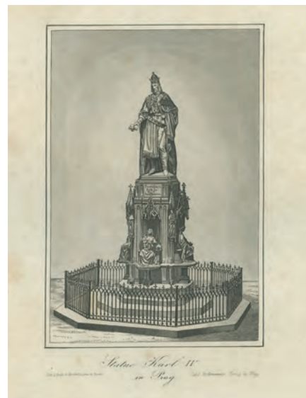
Obr. 4. Pomník Karla IV. na Křížovnickém náměstí, Drážďany–Praha, kolem poloviny 19. století, oceloryt na papíře.