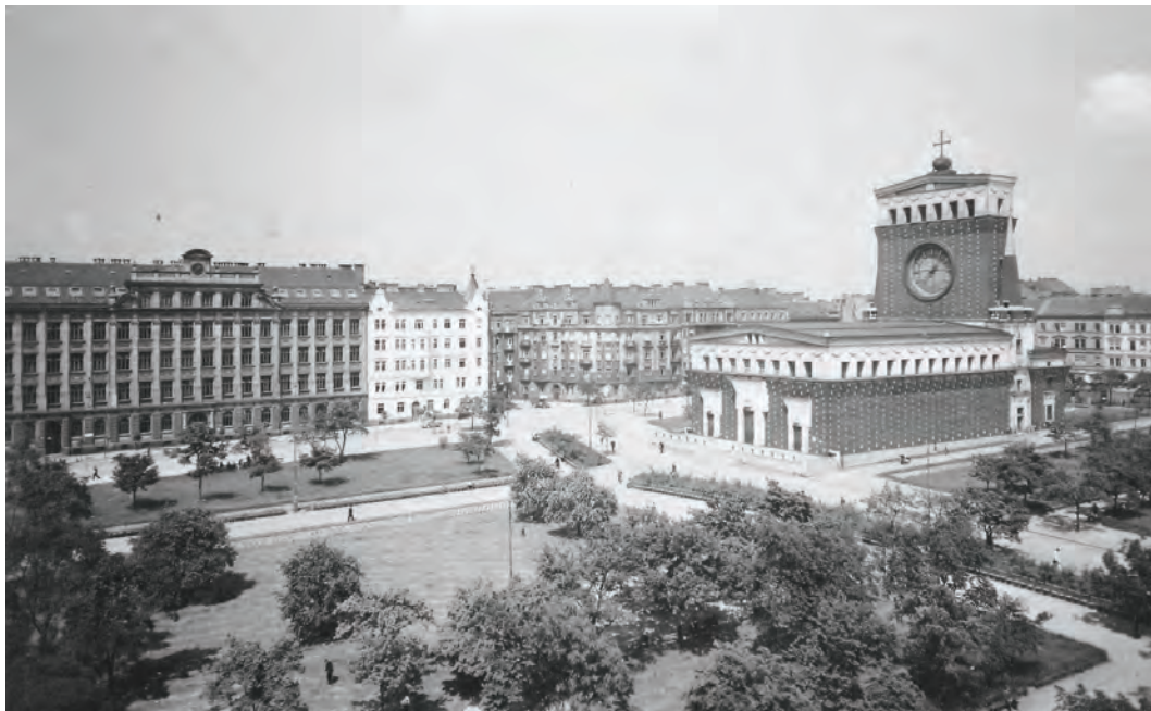
Náměstí Jiřího z Poděbrad